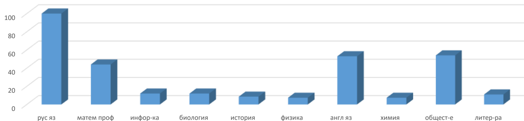
Процент участия выпускников по предметам